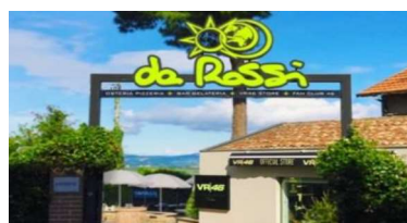
Ristorante "Da Rossi"