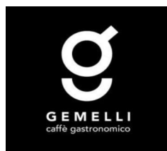
Gemelli - Baia Flaminia