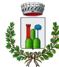
Comune di Tavullia