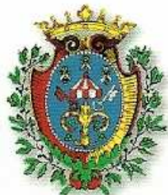
Comune di Urbania